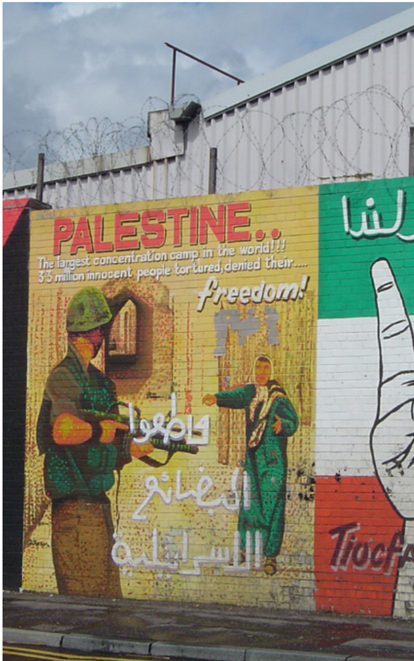
Grffiti in Ireland compares contemporary Israeli policy to that of the Nazis